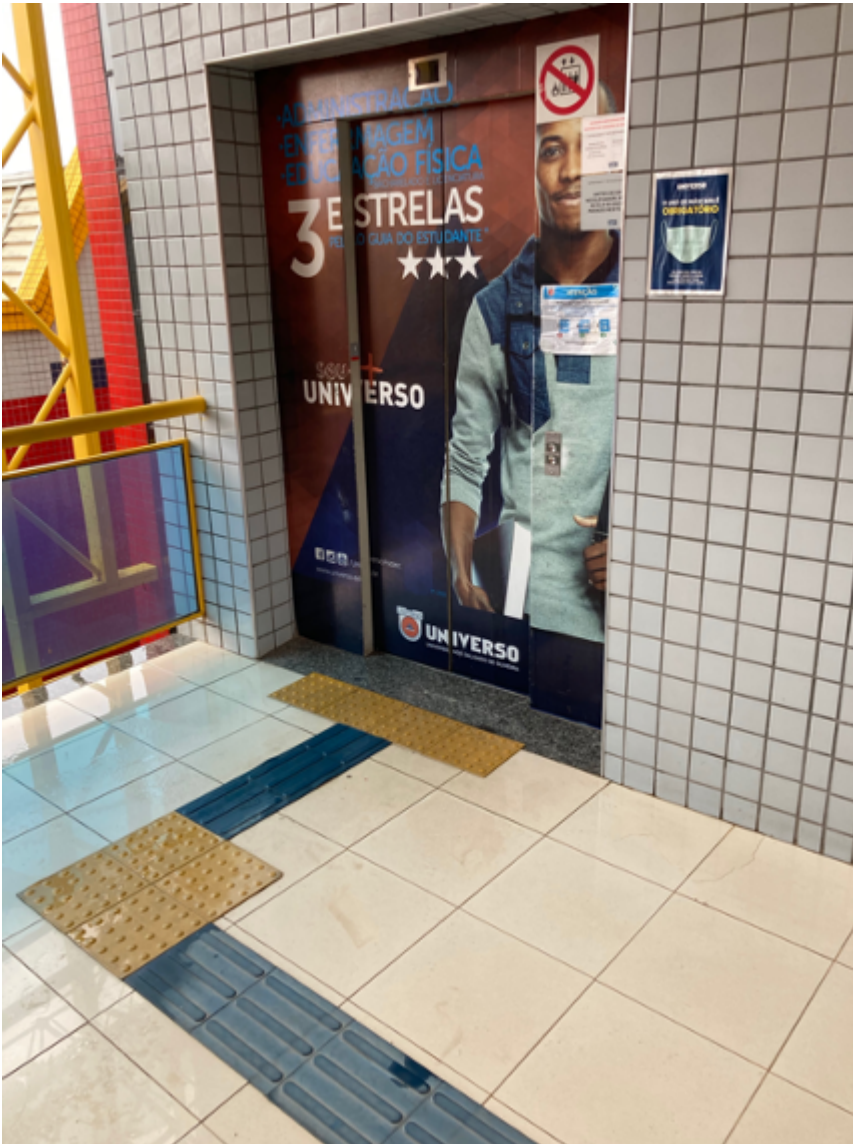
Entrada do Elevador no segundo piso dos laboratórios