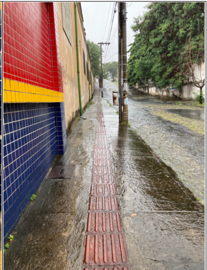
Calçada externa da entrada de alunos