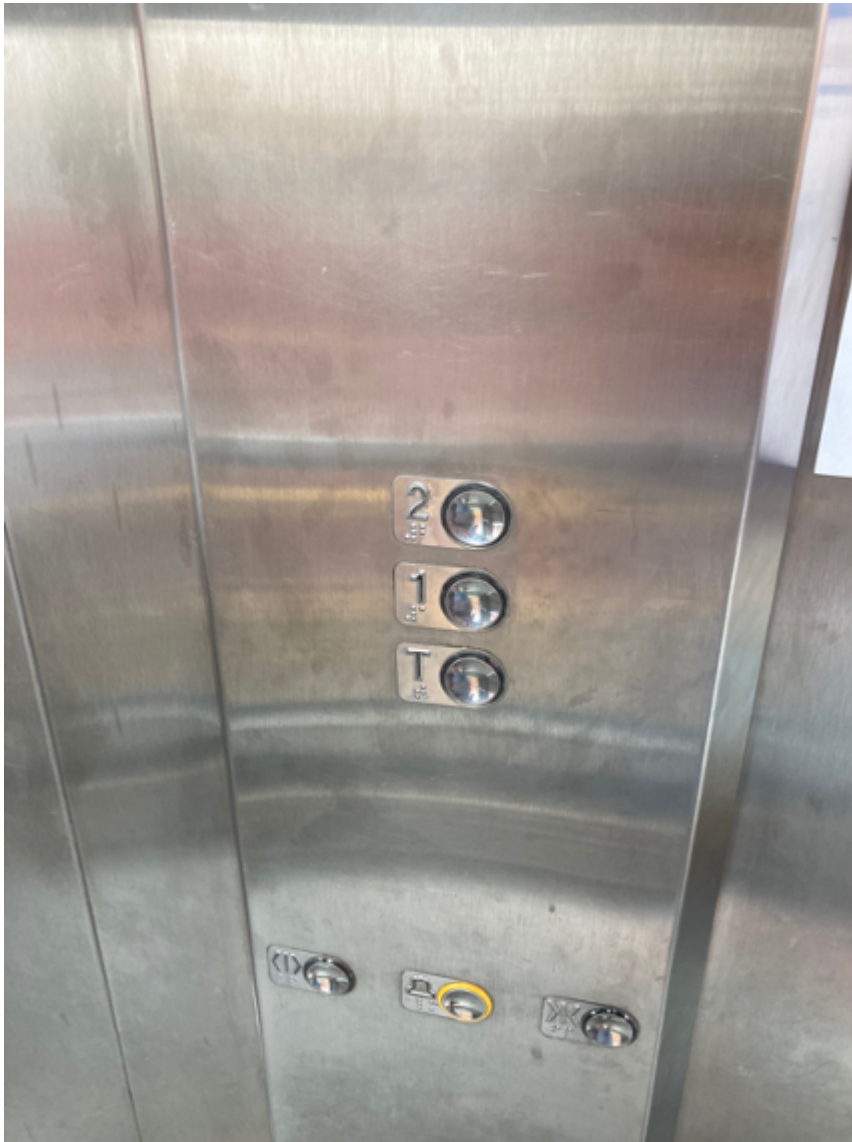
Sinalização em Braille dos botões do elevador