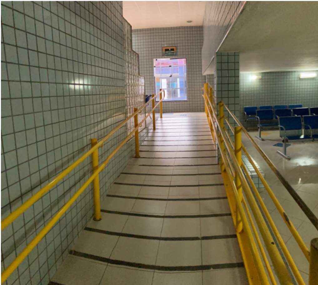
Rampa de acesso ao financeiro