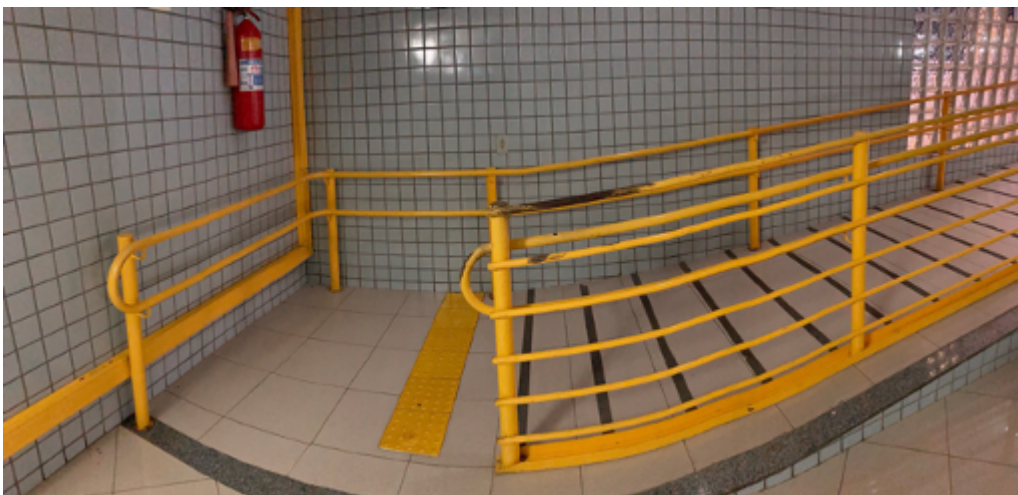
Rampa de acesso ao financeiro