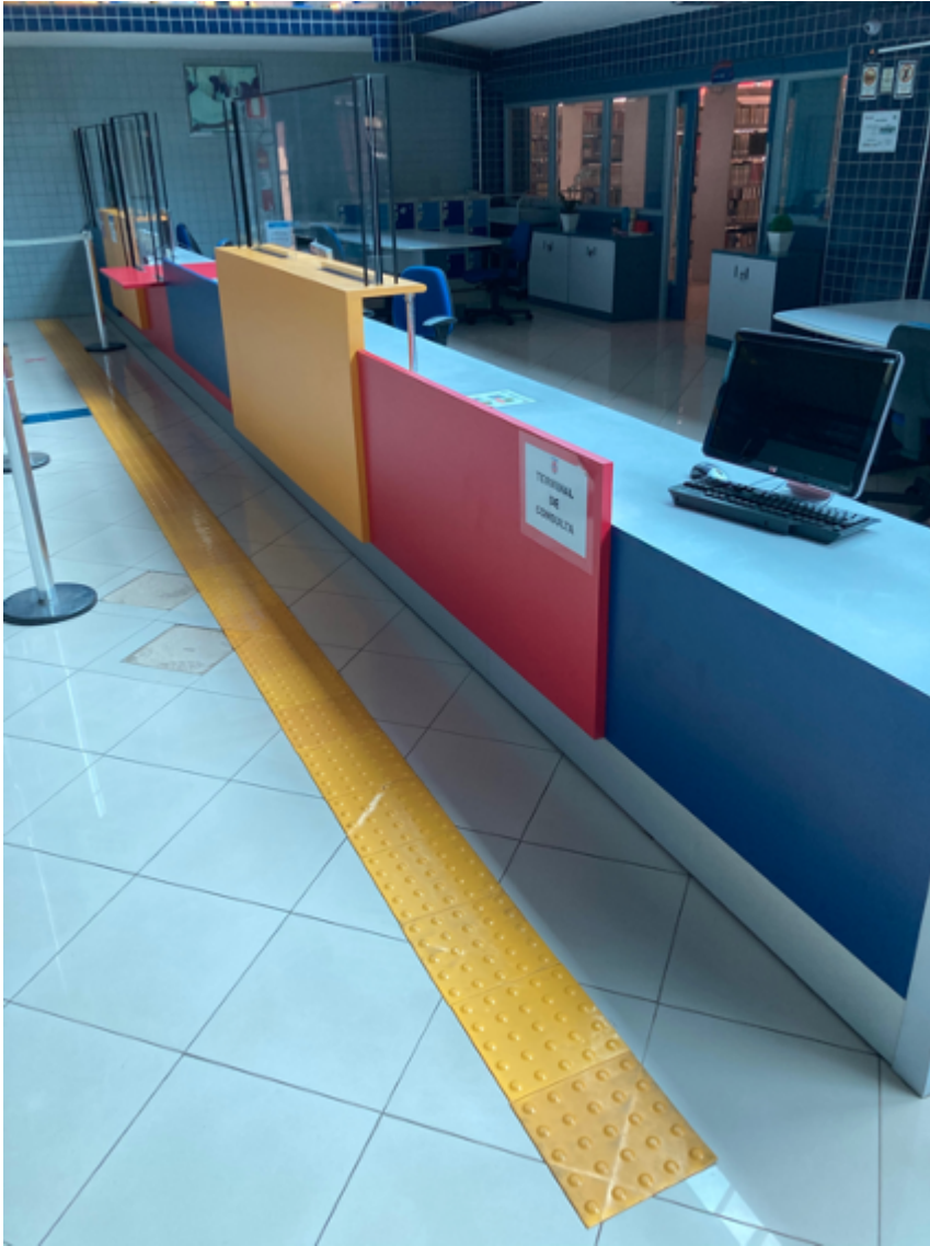
Balcão de atendimento