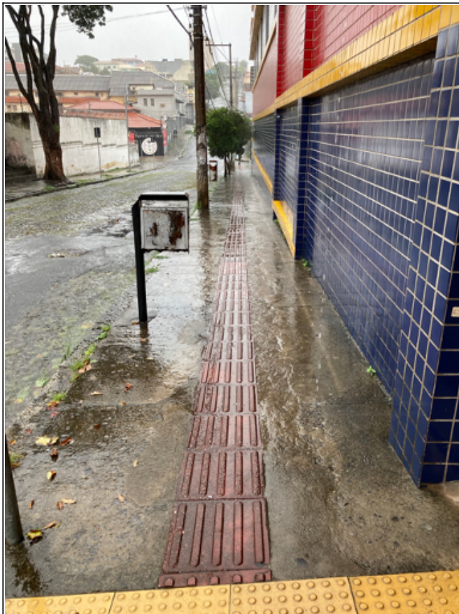
Calçada externa da entrada de alunos

Os rebaixamentos das calçadas atendem aos critérios definidos pelas NBRs 9050/2015 e 16537/2016 da ABNT;