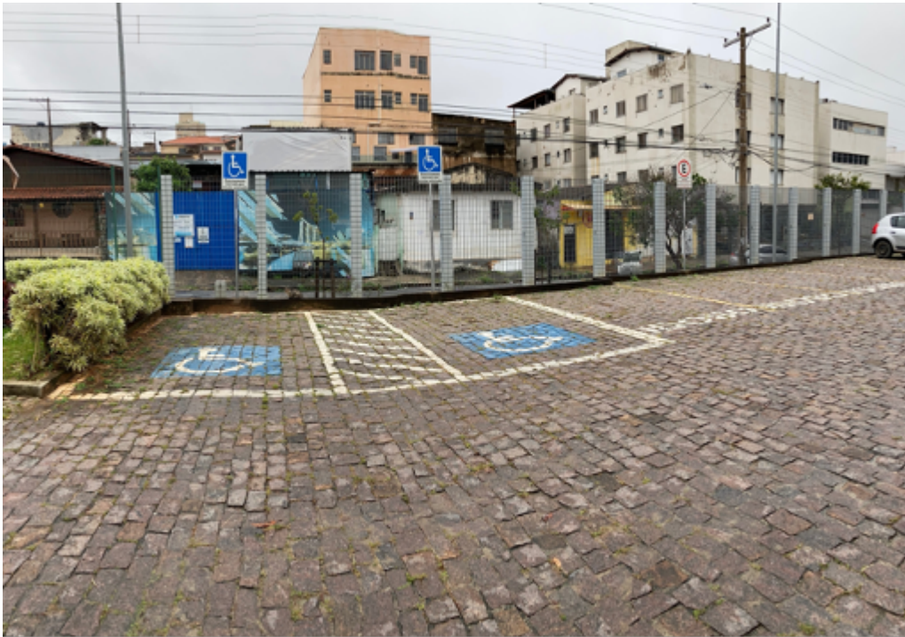
Vagas destinadas ao PCD e Idosos.