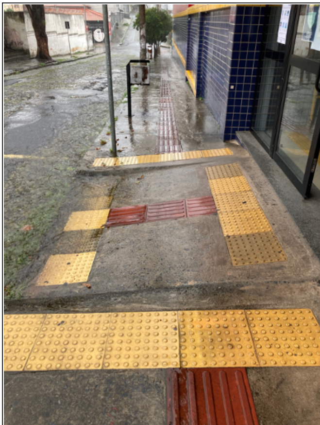
Rampa de acesso da entrada de alunos