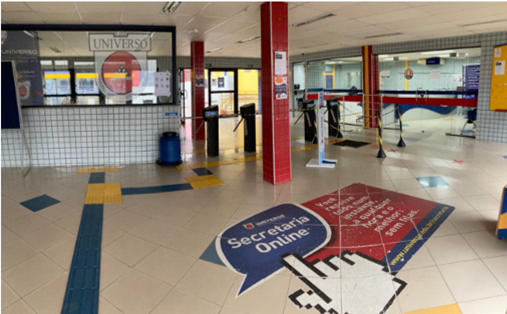
Entrada do campus.