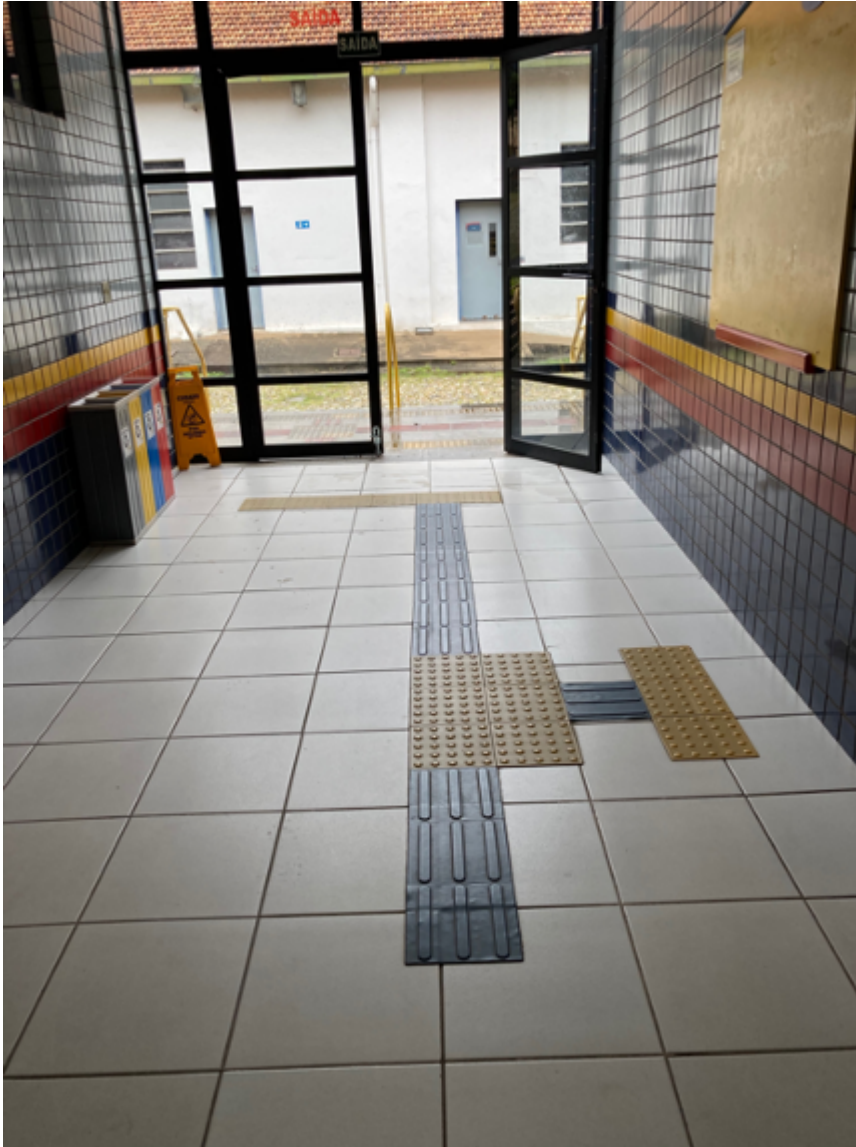
Entrada do Bloco B1 de salas de aula