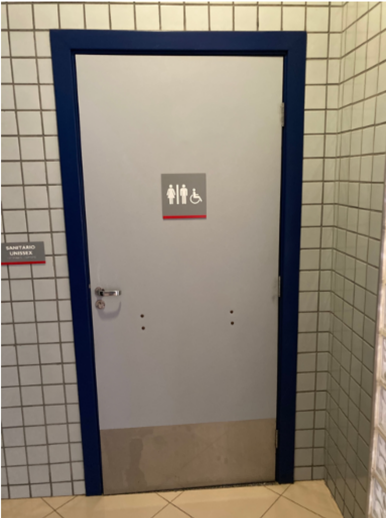
Porta dos sanitários acessíveis

O sanitário acessível atende aos critérios definidos pela NBR 9050/2015 da ABNT;