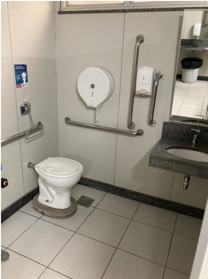
Vaso de Sanitário acessível