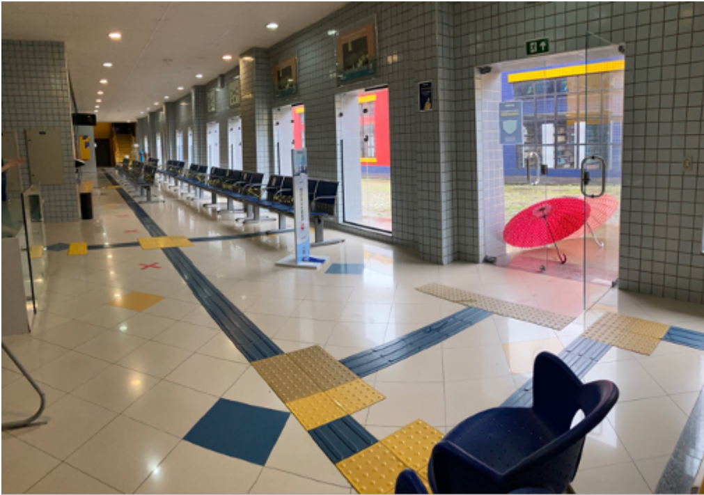
Hall da secretaria