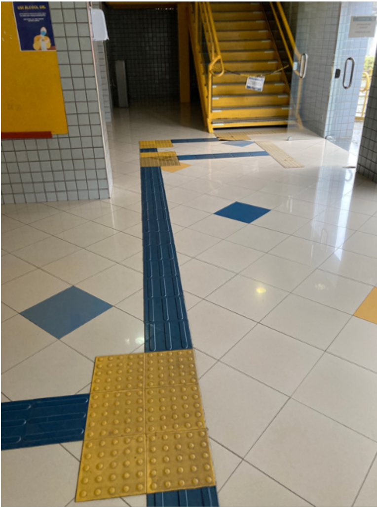
Escada para o piso da Direção