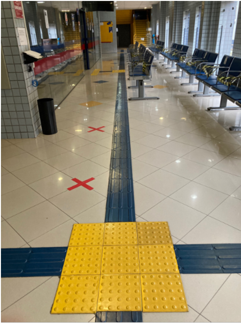
Hall da secretaria