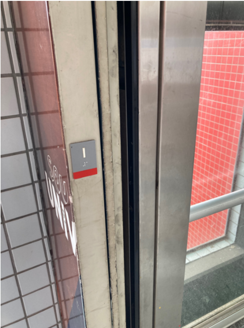
Sinalização do piso do elevador em braile