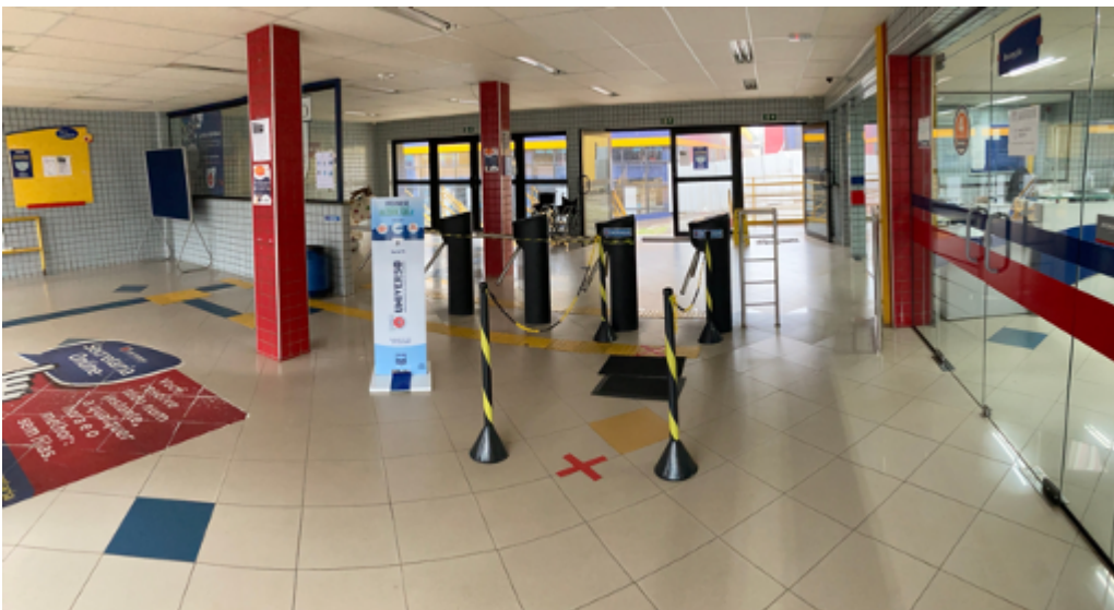
Outro ângulo da entrada do campus