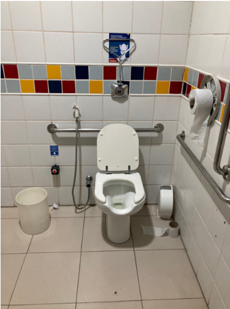
Vaso sanitário acessível