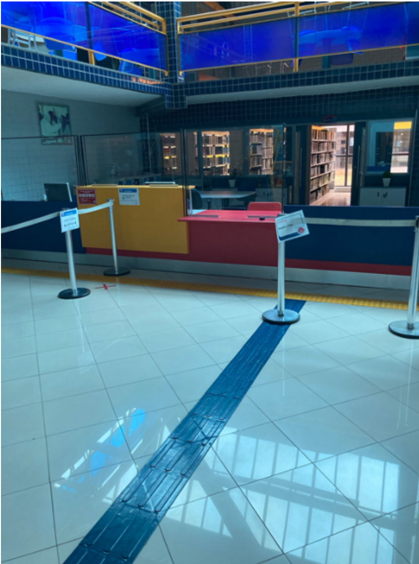
Balcão de atendimento