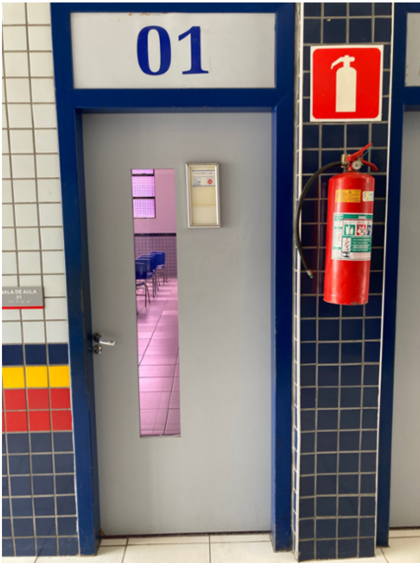
Porta das salas de aula do Bloco B1