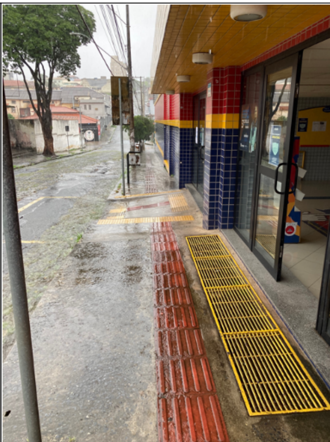
Rampa de acesso da entrada de alunos