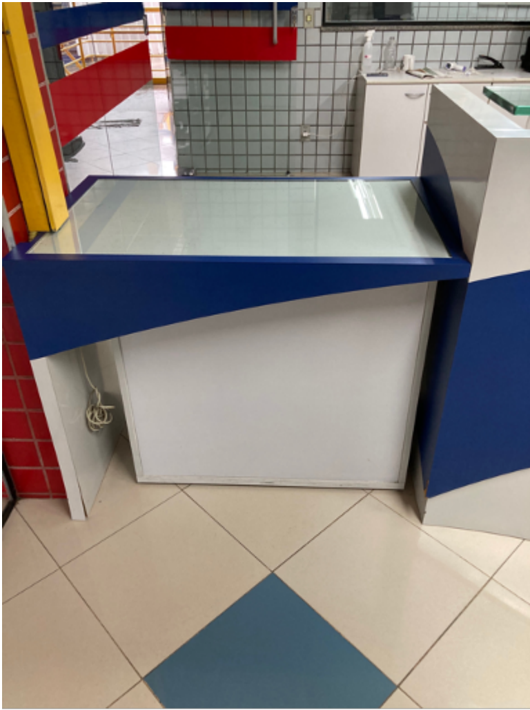
Mobiliário rebaixado da recepção