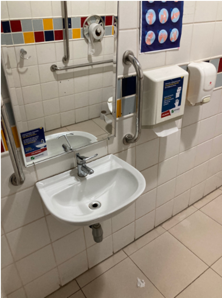
Pia do sanitário acessível