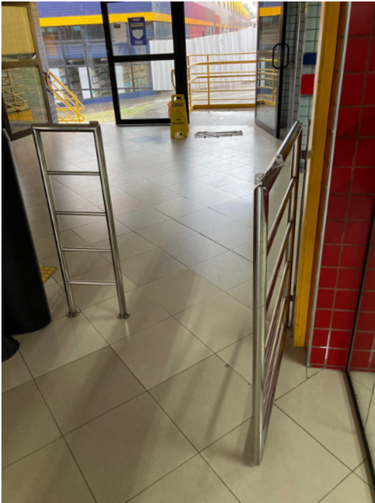
Entrada especial para cadeirantes