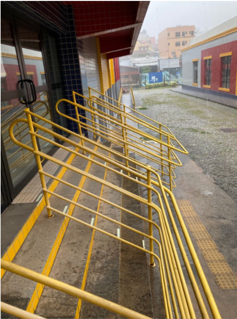
Escada da entrada do campus