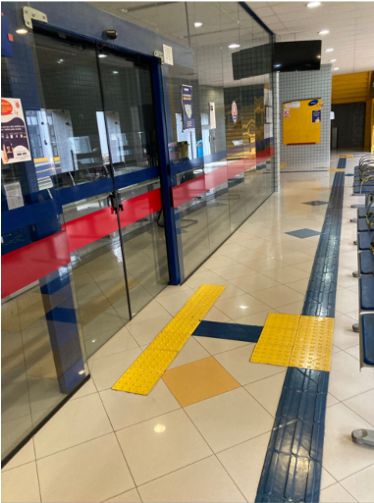
Entrada do atendimento da secretaria