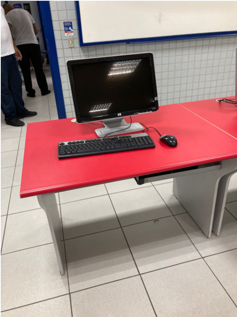
Mobiliário do laboratório de informática

Há espaços reservados para pessoas em cadeira de rodas nas recepções (um módulo de referência), devidamente sinalizado e com espaço para acompanhante;