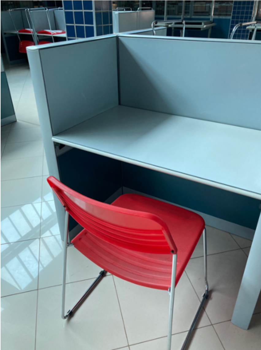
Mesas de estudo individual.