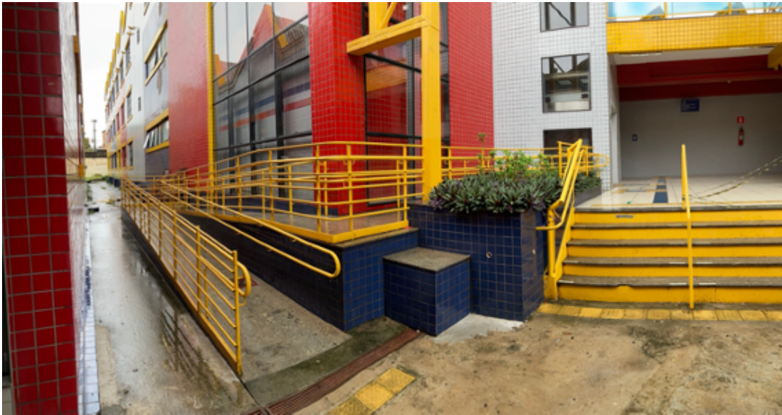
Escada e rampa de acesso ao elevador do Bloco A1