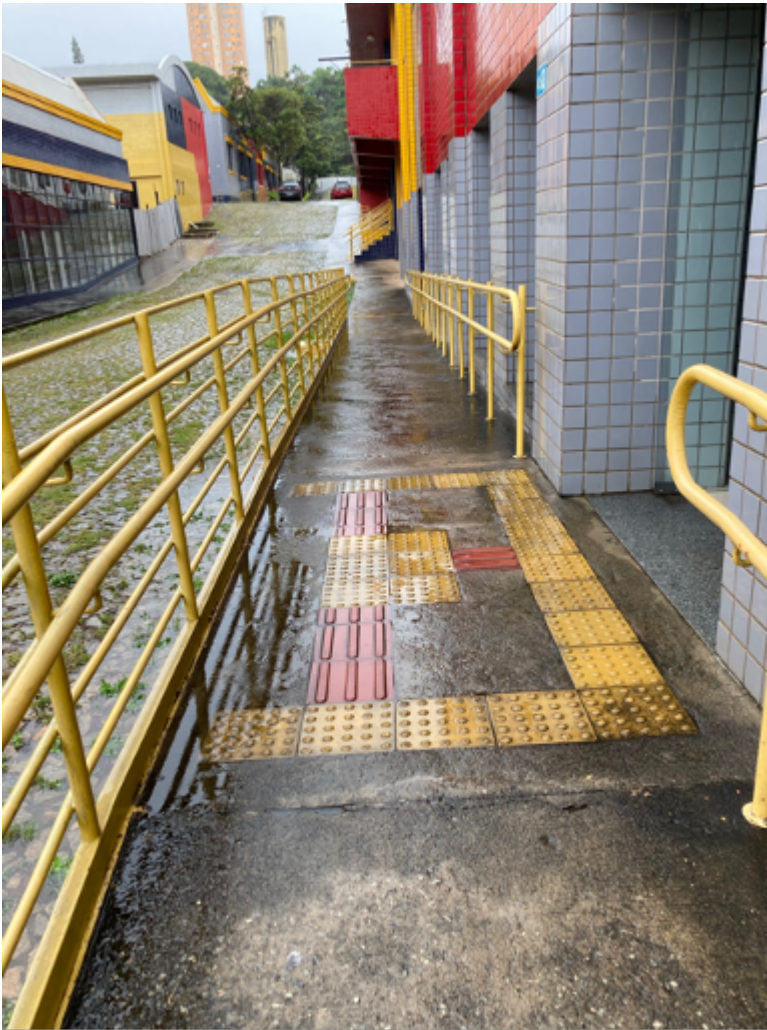
Entrada de acesso à Secretaria e Financeiro