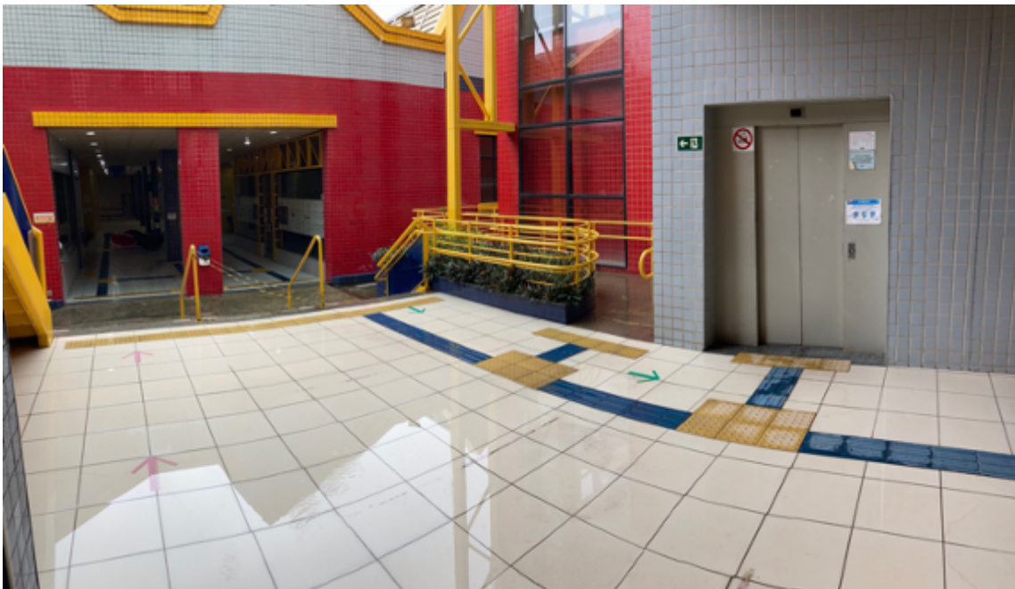
Entrada do elevador no Bloco B1