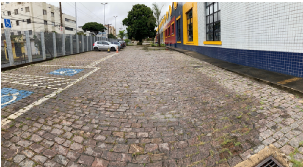
Vagas destinadas ao PCD e Idosos.